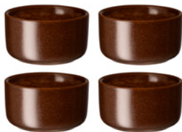
Minivuoka brown edition, 4 kpl

Kivikeraaminen uunivuoka on ajaton vakiotuote jokaiseen keittiöön. Se on kestävä, laadukas ja lasituksen ansiosta helposti puhdistuva, joko käsin pestynä tai astianpesukoneessa. Keraaminen vuoka on aina tyylikäs ja sen voikin nostaa uunista suoraan pöytään ruoan tarjoilemista varten. Kivitavara ei ime kosteutta, hajottaa lämpöä hellästi ja pitää lämmön erinomaisesti.