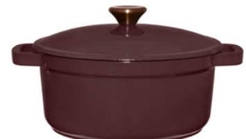
Valurautapata, 24 cm, ruskea

640567 Valurautapata sopii mainiosti samaan pöytään Brown edition -sarjan kanssa. Padassa voi ruskistaa lihat ja kasvikset sekä hauduttaa pataruuat liedellä ja uunissa. Myös pataleivät ja uunipuurot valmistuvat siinä vaivattomasti. Vetoisuus 3,5 L. Kaikille liesityypeille. Uuninkestävä 250 °C. Käsinpesu. Koko: 30.5x24x16.5 cm Materiaali: valurauta, ruostumaton teräs