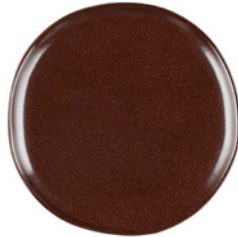
Lautanen brown edition, 20 cm

641946 Koko: 20x20x2 cm Materiaali: kivikeramiikka