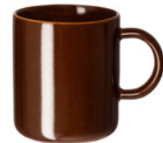
Muki brown edition, 30 cl

641954 Koko: 11.5x8x9.5 cm Materiaali: kivikeramiikka